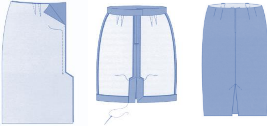
Görsel 1. Açık Yırtmaç (Ergen, vd., 2020)

9. Fazla iplikleri temizleyip ütöleyiniz.